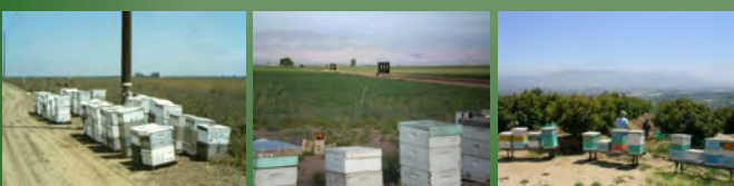
Colmenas polinizando cultivos de alfalfa en Argentina y aguacate en Chile

Como podemos apreciar la polinización es una actividad rentable y en crecimiento, no solo en los países anteriores, cada vez la importancia de la polinización se expande por distintas regiones. El aumento en el número de colmenas rentadas para polinizar cultivos, está supeditado en buena medida a la promoción y concienciación de los agricultores sobre las ventajas que ello representa, inducción que puede ser impulsada por los propios apicultores con el apoyo del sector oficial y un mayor número de estudios científicos sobre la materia que demuestren aún mas claro su importancia.