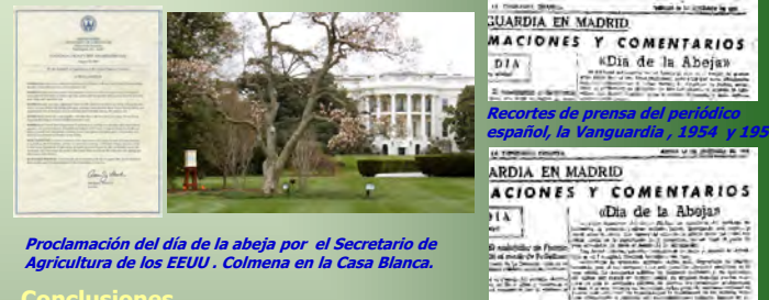
Proclamación del día de la abeja por el Secretario de Agricultura de los EEUU. Colmena en la Casa Blanca.