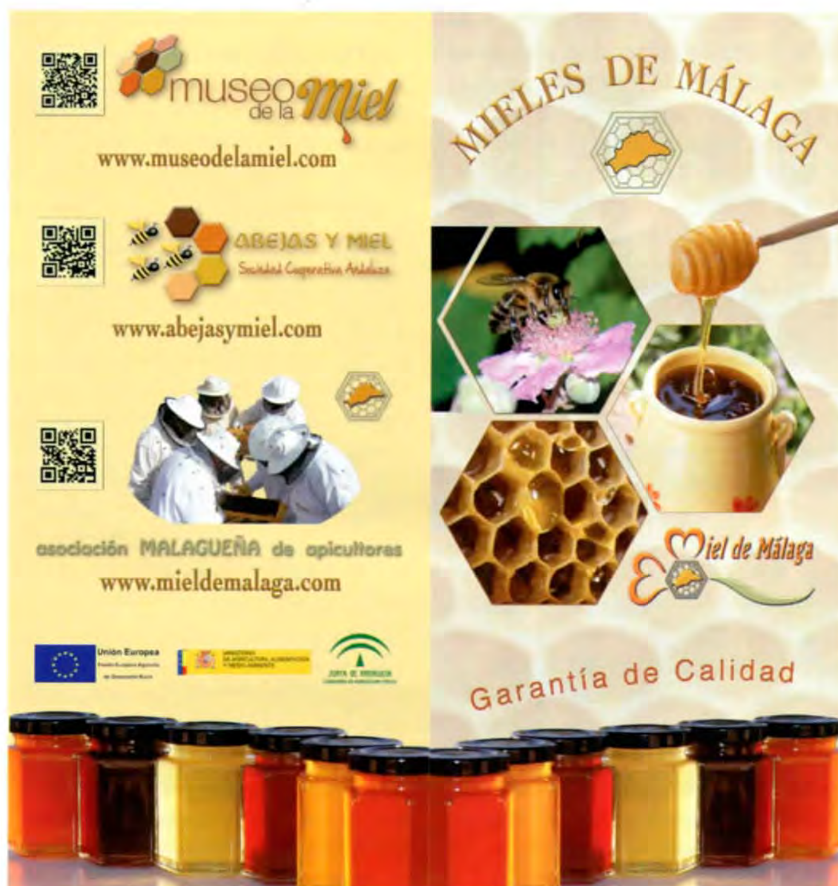
Díptico de promoción de la Marca de Garantía de las mieles malagueñas

controles, inspecciones y toma de muestras, que consideren oportunos los Servicios Técnicos responsables, prestando la colaboración que éstos precisen.