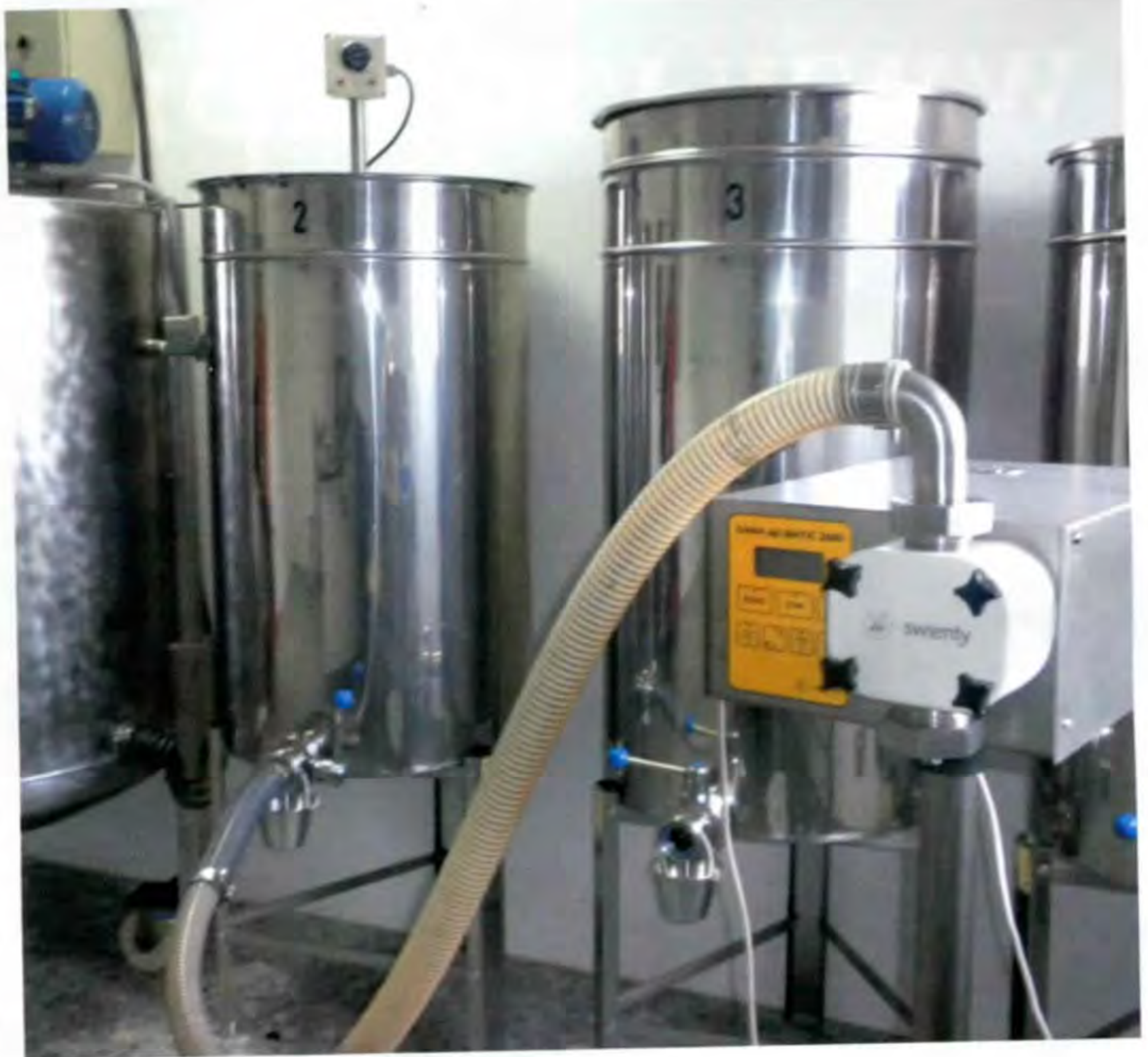
Instalaciones de la cooperativa Abejas y Miel

1. Están legitimados para usar la marca, aquellos que produzcan o elaboren en el territorio definido anteriormente "Miel de Málaga" conforme a las condiciones objetivas ya expuestas, siempre y