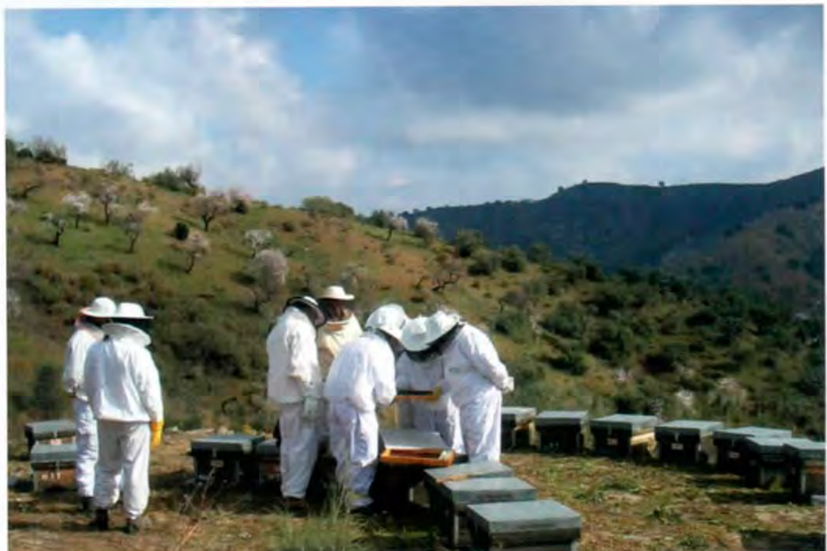
Las prácticas de manejo en el colmenar deberán buscar preservar la máxima calidad de la miel

Todas las empresas que deseen acogerse al Reglamento de Uso de la Marca, deben estar inscritas en el Registro de