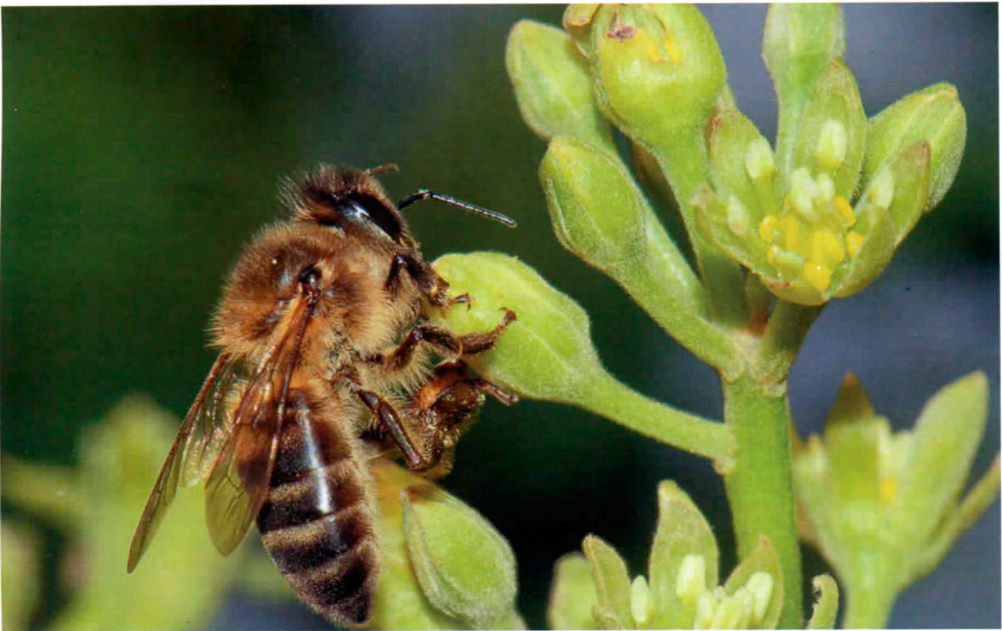
Abeja en floración de aguacate (en la página derecha exudación de mielatos en las bellotas)