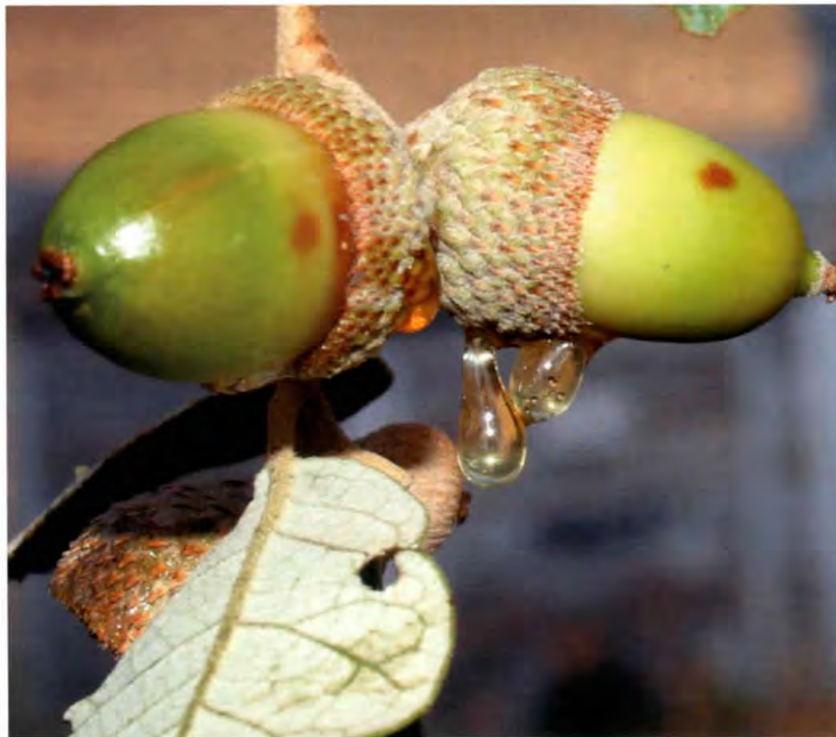
Bellotas de Quercus exudando mielato

2. En todo caso, el usuario de la marca de garantía deberá asumir por cuenta propia las indemnizaciones y perjuicios