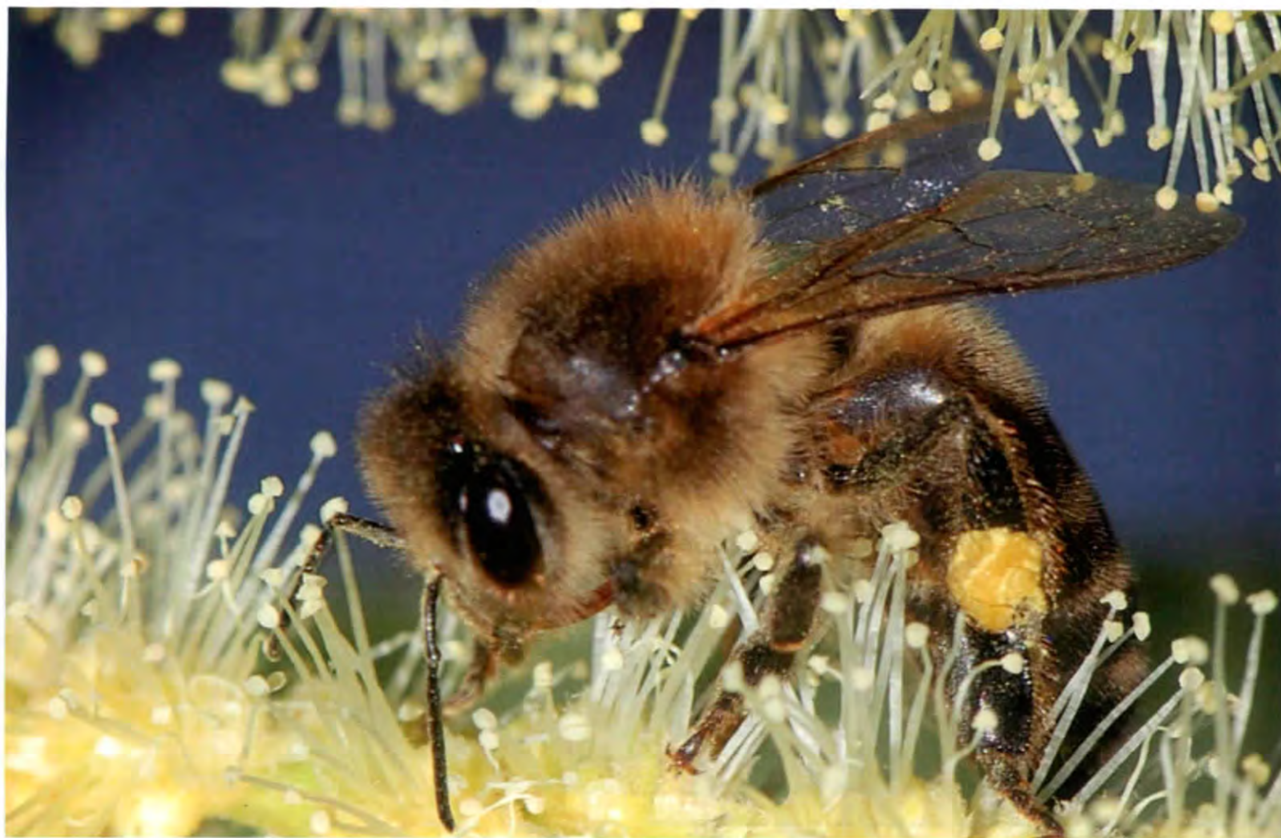
Abeja en floración de castaño

4. Cualquier persona cuyos productos o servicios provengan de la zona geográfica protegida y cumplan las condiciones prescritas en este Reglamento de uso, podrán utilizar la Marca.